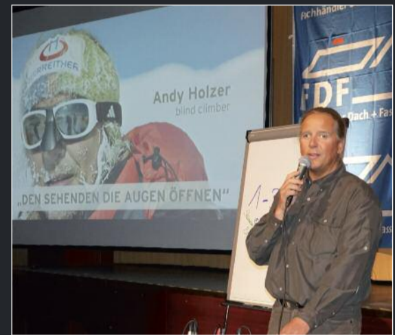
Ansteckenden Optimismus verbreitete in Nürnberg der blinde Bergsteiger Andy Holzer. Ohne Augenlicht hat er sechs der 'sieben Summits', der höchsten Gipfel der sieben Kontinente erklommen.

Sanieren' stellte er Lösungen im Bereich 'Dach und Wand' vor. Mit immerhin 38 Prozent Anteil erneuerbarer Energien werden Gebäude in Südtirol heute betrieben. In ganz Italien kommt dieser Wert nur auf schlappe 7 Prozent, so Erlacher. Dazu stellte er verschiedene Ansätze vor, in Zukunft noch effizientere Gebäude zu bauen.